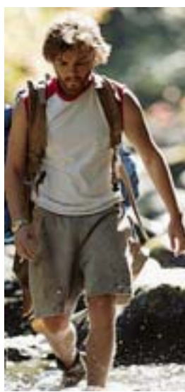
Icone Emile Hirsch in «Into the Wild», 2007, regia di Sean Penn

Scelte epiche, che nulla hanno a che vedere con il simpatico «fumetto» di Bridget, della quale però nessuno parla male, limitandosi a definirla abbastanza realistica nella sua goffaggine. E alla fine, perché no? Vincente.